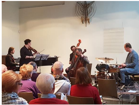
Rembrandt Frerichs Trio en gasten